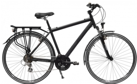
VTC Arcade Escape

21 vitesses | Cadre aluminium | Roue 28 pouces | Pneus anti crevaison | Suspension avant