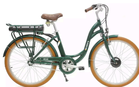
VAE Arcade E-Colors

21 vitesses | Cadre aluminium | Roue 28 pouces | Pneus anti crevaison | Suspension avant